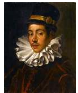
伊藤マンショの肖像

神戸市立博物館：特別展は7月17日まで開催 休館日は月曜日（7/17は開催） 神戸市京町24 Tel. 078-391-0035