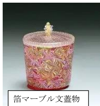
箔マーブル文蓋物

まれてきた日本の深い美意識からも折々に示唆をもらいながら作品を創られておられるそうです。松島先生とお話をしていますと突然、在原業平の和歌『晴るる夜の 星か川辺の 蛍かも わが住む方の 海人の焚く火か』（伊勢物語 87段に出てくる歌で、芦屋の里の方向にある漁火と分かっているながら、明滅するその光を夜空の星や川辺の蛍にみたとて、凝ってみせています）が突然出てきて、自分の知識の無さもあり慌ててしまいます。それはともかく、松島先生の作品はどれを観ても発色が大変美しく、古代オリエントのオマージュとして「太陽」、「ナツメヤシ」、「山羊」がデザインされているようでじっと見入ってしまいます（間違っていたらゴメンナサイ）。皆様も今一度、私達の街に収蔵されている「古代からのバトン」をじっくりご覧になってください。そこには様々な松島先生のイメージが込められているのが見えてきますよ。