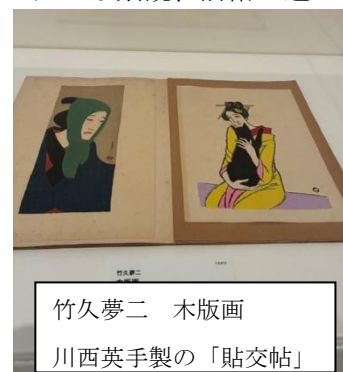
竹久夢二 木版画 川西英手製の「貼交帖」

とする昭和期の画家・版画家たちが描き出した都市生活やモダンな景観、前衛と遊びの世界を展示しており、先日、早速拝見して来ました。明治後期から大正時代に入ると、交通の便が進み、郊外に街が広がりました。別の言い方をすればモダン化していきました。結果、貧富の差が広がりましたが、夢二はその暗い部分にも目を向けたのだそうで、明らかに構図がほぼ同じ2点の作品があり、女性の表情の違いでその明暗を示していた作品は印象的でした。また夢二は江戸時代の浮世絵以来、美人画の定番であった細い釣り目顔