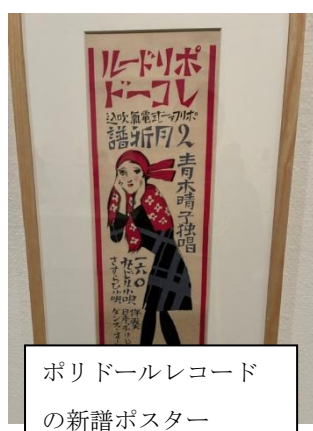
ポリドールレコード の新譜ポスター

れた一人で、自身が収集した膨大な版画コレクションの3分の1以上が夢二の版画・書籍・グッズなどで占められています。京都国立近代美術館では、「モダン都市生活と竹久夢二」と題して大正期のモダンな大衆文化時代のスターとして幅広い人々に親しまれた夢二の作品とともに、夢二に憧れた川西先生や恩地孝四郎をはじめ